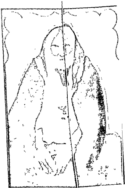
ब्रह्मी भूता श्रीकाशीनाथ तातपादा ।